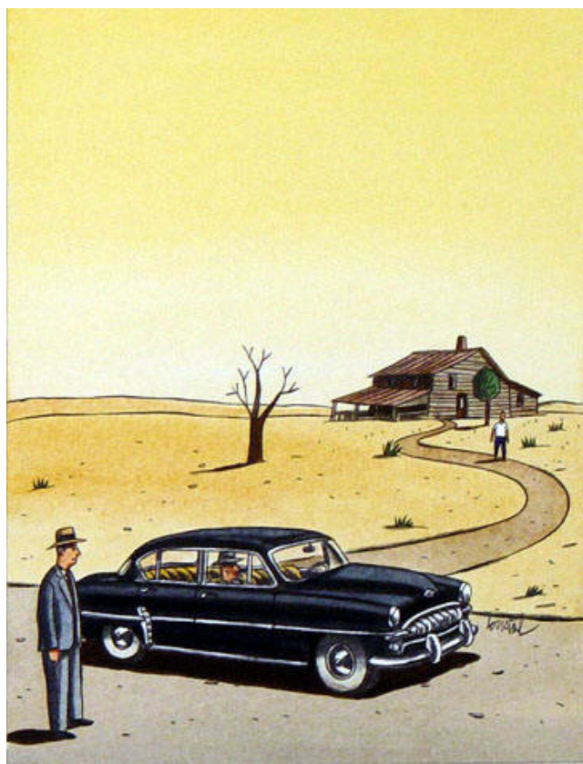
Illustrations pour Les frères Rico (2004/Omnibus)

Conception : Jean-François Merle, Loustal et la BILIPO