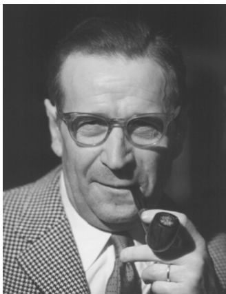
Georges Simenon