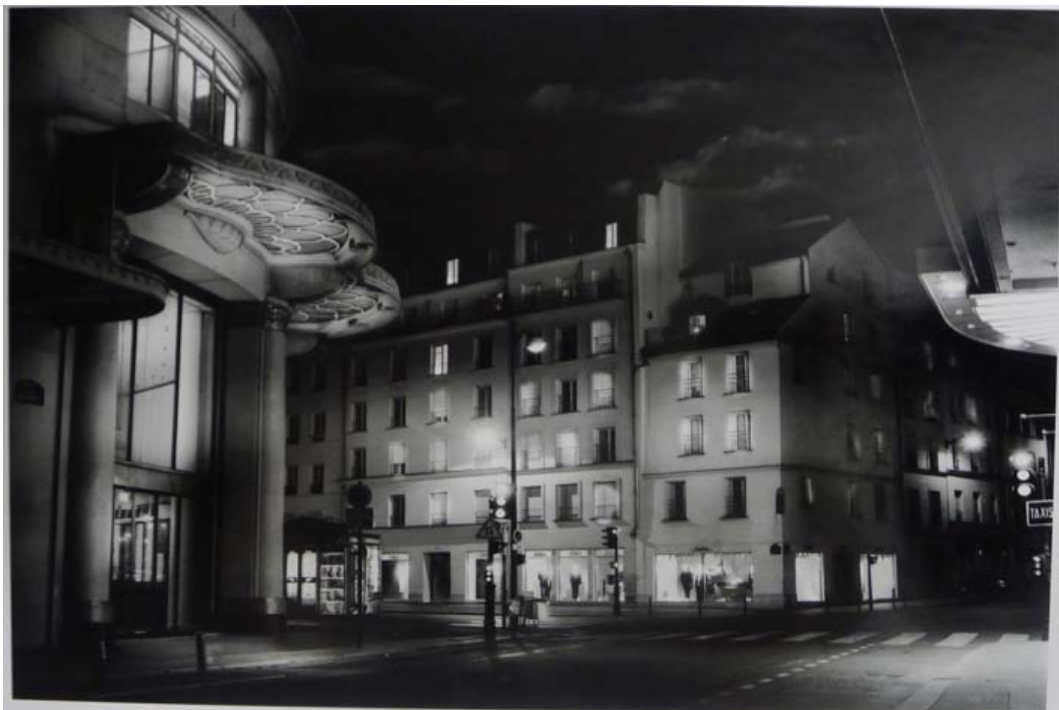
Jean-Michel Berts, Le Bon Marché , tirage au gélatino-bromure d'argent, 2003