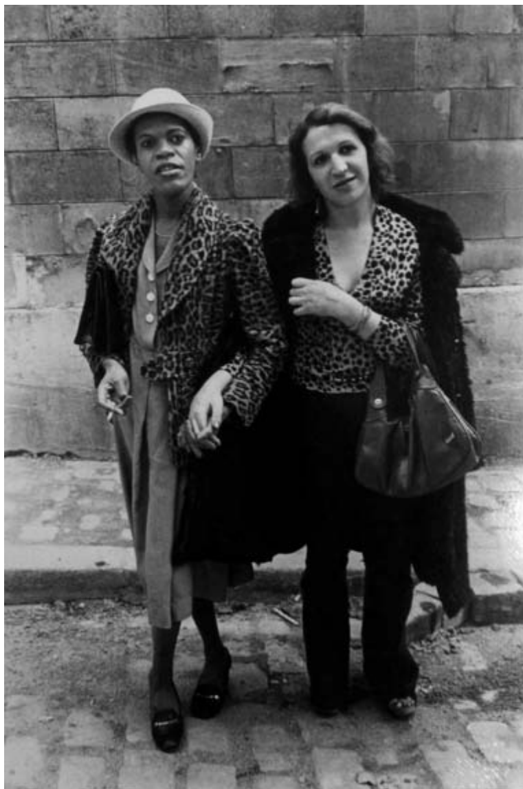
Jane Evelyn Atwood, L'Institut départemental des aveugles - Saint-Mandé , France, 1980, tirage au gélatino-bromure d'argent, 1980