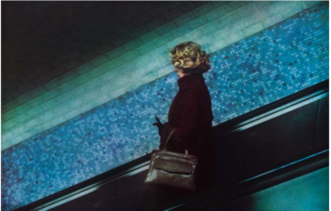
Dolorès Marat, La femme au sac à main, Charles-de-Gaulle-Etoile , tirage Fresson en quadrichromie, 1987