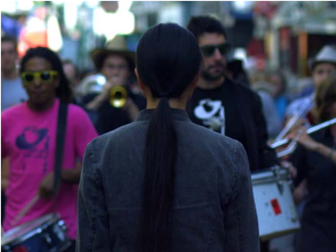
Kimsooja, A needle woman in Paris , vidéo, 25 min, Edition 1/6 © Kimsooja / Fonds Municipal d'Art contemporain de la Ville de Paris