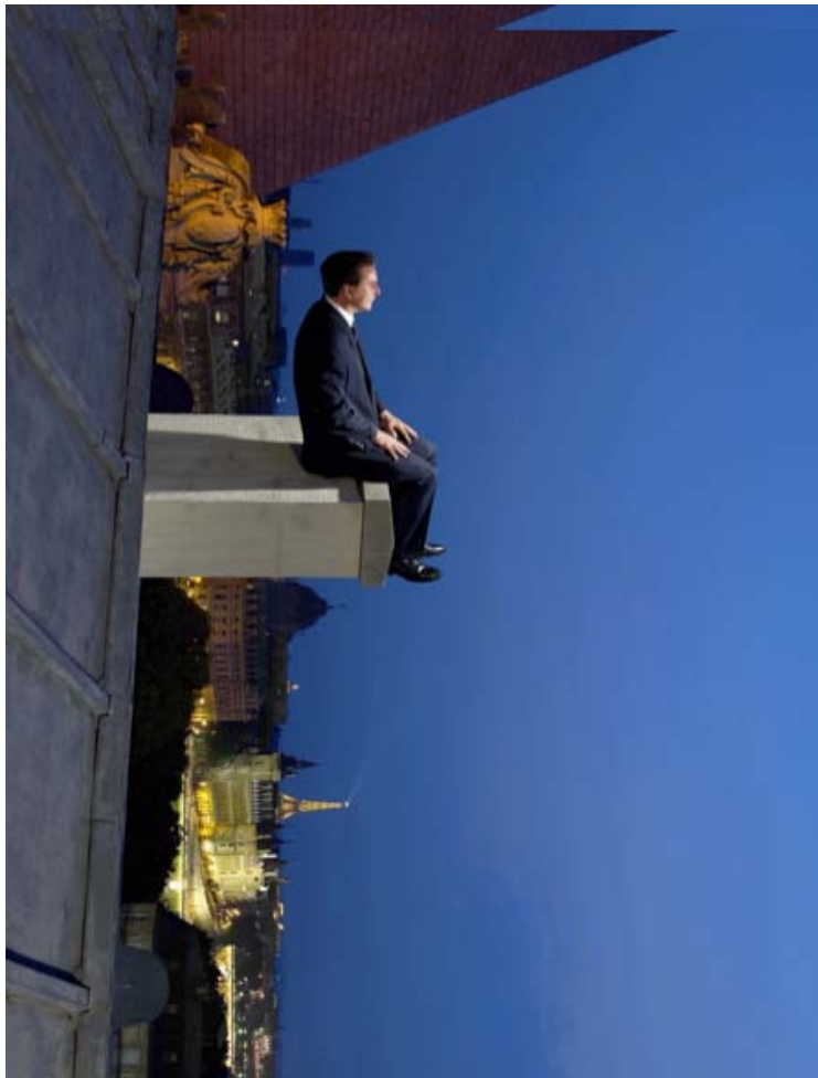
Philippe Ramette, Contemplation irrationnelle , tirage couleur à développement chromogène, 2005, 150 x 125 cm, ADAGP / MEP © ADAGP 2014