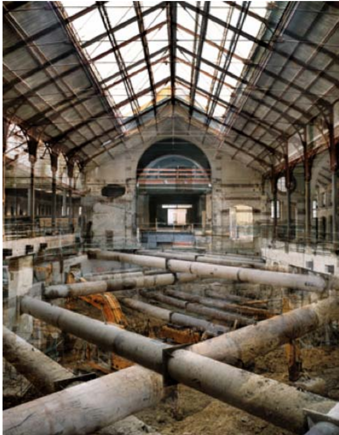
Stéphane Couturier, 104 rue d'Aubervilliers - Paris 19, Photographie n°1 , tirage à développement chromogène, 2008