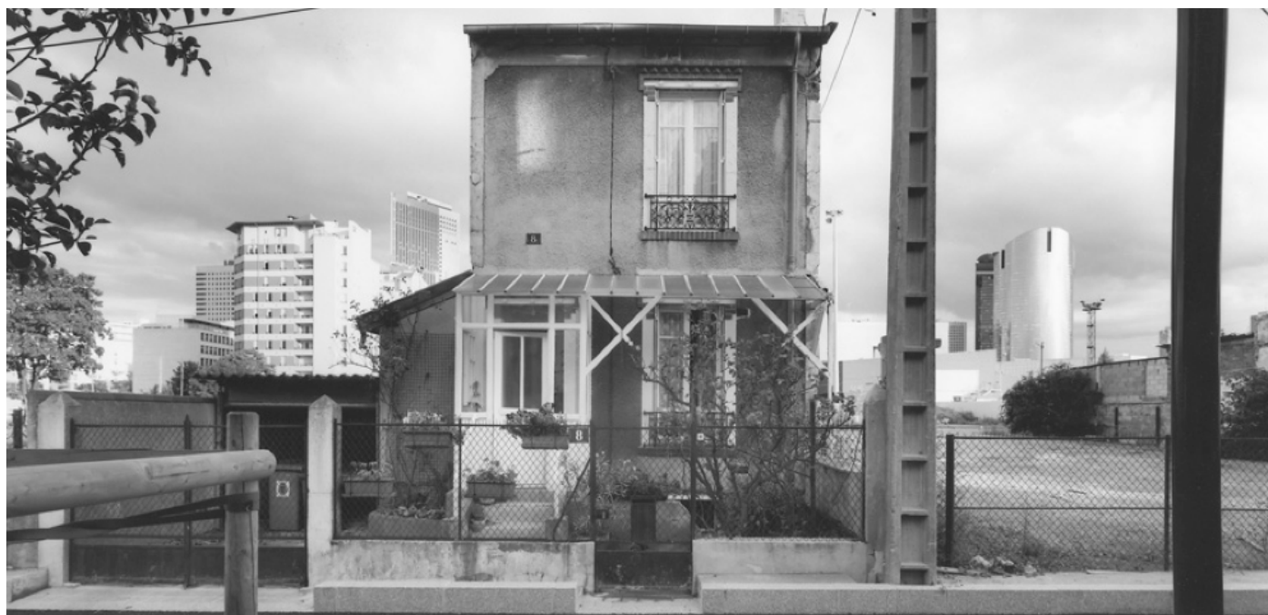
Gabriele Basilico, Paris , tirage au gélatino-bromure d'argent viré au sélénium, 2002

>> Les visuels de ce dossier de presse sont disponibles en HD sur demande à : communication@paris-bibliotheques.org