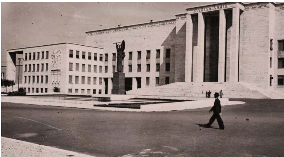
>> Rome - Le palais des études dans la Cité universitaire, vers 1935. Photographie positive sur papier gelatino-argentique / 12 x 21 cm. Paris, Bibliothèque de l'Hôtel de Ville.

À travers les photographies de cités modernes (New York) ou de splendeurs restaurées (Florence, Venise, Hanoi ou Alger), de vues aériennes ou de détails, d'approches quasi ethnographiques des populations ou d'ensembles monumentaux, les photographies réunies par leur singularité, leur beauté et leur intérêt documentaire, révèlent plusieurs niveaux de lecture, pour aborder l'évolution de l'esthétique et de la conception de l'univers urbain, à l'aune des grands bouleversements du monde.