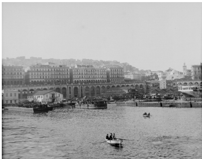
>> Alger. Embarquement du 1 er Zouave, août 1914. Photographie de Georges Chevrier (1880- 1940). Paris, Bibliothèque de l'Hôtel de Ville (Fonds Lausi). Négatif n&b sur nitrate de cellulose / 9 x 12 cm

LA BIBLIOTHÈQUE DE L'HÔTEL DE VILLE DE PARIS PRÉSENTE À LA GALERIE DES BIBLIOTHÈQUES QUELQUES-UNS DE SES TRÉSORS PHOTOGRAPHIQUES À L'INTÉRÊT DOCUMENTAIRE EXCEPTIONNEL À L'OCCASION DE CETTE EXPOSITION CONSACRÉE AUX VILLES ÉTRANGÈRES DE LA FIN 1870 À 1939. EN UN VÉRITABLE VOYAGE DANS L'ESPACE ET DANS LE TEMPS, UN EXCEPTIONNEL ENSEMBLE DE PHOTOGRAPHIES PROVENANT DU MONDE ENTIER RÉVÈLE LE PANORAMA ÉTRANGE ET CONTRASTÉ DES GRANDES VILLES BASCULANT DANS LA MODERNITÉ, AU TOURNANT DU XX E SIÈCLE.