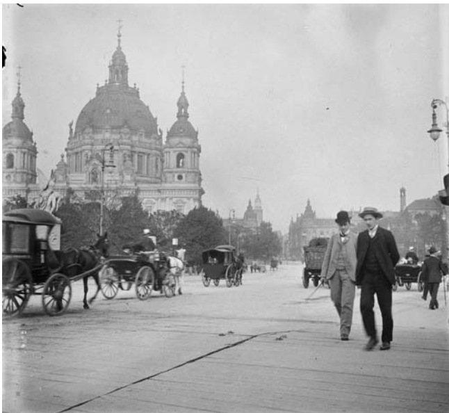
>> Berlin. Berliner Dom, vers 1902. Paris, Bibliothèque de l'Hôtel de ville (Fonds Lausi). Négatif sur verre au gélatinobromure d'argent (vue stéréoscopique partielle) / 4,7 x 4,7 cm

>> Les visuels de ce dossier de presse sont disponibles en HD sur demande à : communication@paris-bibliotheques.org