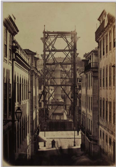
>> Lisbonne. Construction de la statue du roi Dom Pedro, 1869. Paris, Bibliothèque de l'Hôtel de Ville (fonds Davioud). Photographie positive sur papier albuminé / 39 x 27 cm

Ces photographies sont issues de plusieurs fonds de la Bibliothèque de l'Hôtel de Ville. Certaines s'inscrivent dans les échanges de publications entre la Préfecture de la Seine et les municipalités d'autres grandes villes du monde (Florence, Vienne, Toronto, Montréal, New York, Melbourne) ; d'autres ont été envoyées à l'Hôtel de Ville en remerciement ou à l'occasion de visites officielles ; les documents sur le Maghreb proviennent du « fonds colonial » de la bibliothèque qui conserve plusieurs milliers de publications sur les anciennes colonies françaises. Enfin, certaines photographies ont été données à la Bibliothèque et appartiennent aux fonds Davioud, d'Espezel, Benoit-Levy et Lausi.