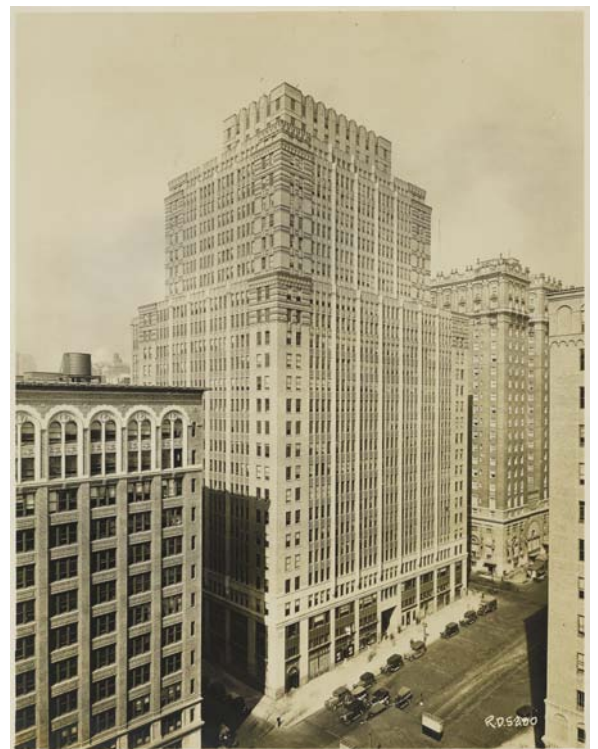
>> New York. Gratte-ciel, 2 Park avenue, 1930. Paris, Bibliothèque de l'Hôtel de Ville. Photographie positive sur papier aristotype à la gélatine / 24,2 x 18,8 cm