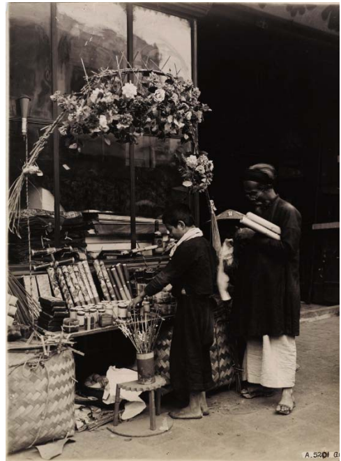
>> Hanoï. Marchande de fleurs en papier et de feux de Bengales, 1929. Photographie positive sur papier au gelatino bromure d'argent / 23 x 17 cm