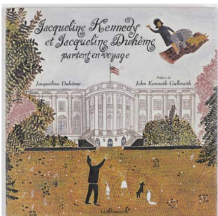
J. Duhême, pour Gallimard © Adagp, Paris 2019