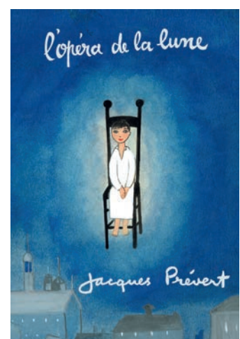
J. Duhême, couv. L'opéra de la lune éd. Gallimard © Adagp, Paris 2019