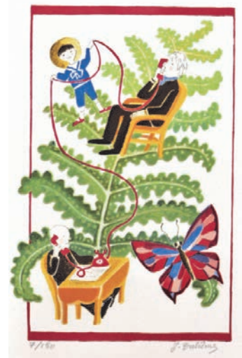
Ill. J. Duhême pour Tistou, les pouces verts de M. Druon © Adagp, Paris 2019