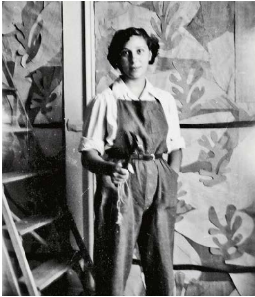
Aide d'atelier chez Matisse.

Cette exposition est conçue comme un dialogue entre les textes, les poésies, la musique (chansons de Prévert, partition de L'Opéra de la lune ) et les images sous leurs diverses formes : maquettes, croquis, dessins originaux, correspondances illustrées, photographies, tapisseries, albums publiés. Ainsi seront croisés les talents de l'artiste, dans les différentes parties de l'exposition.