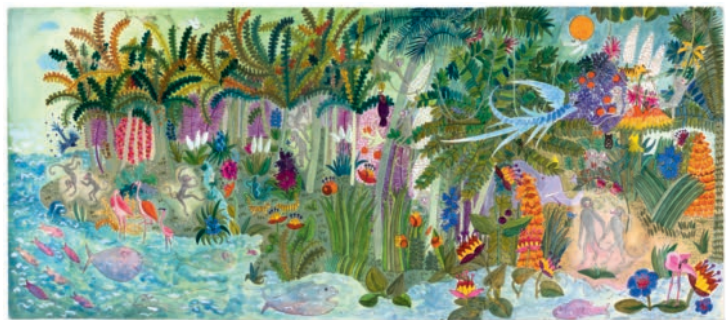
J. Duhême, Atome © Adagp, Paris 2019