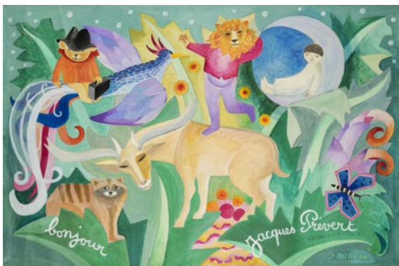
J. Duhême, carton pour tapisserie "bonjour Jacques Prévert" © Adagp, Paris 2019

Le copyright à mentionner auprès de toute reproduction sera : nom de l'auteur, titre et date de l'œuvre suivie de © Adagp, Paris 2019, et ce, quelle que soit la provenance de l'image ou le lieu de conservation de l'œuvre.